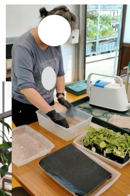
挿し木ケースメンテナンス